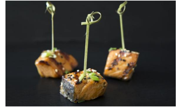
141 Мини-филе лосося гриль, маринованное в терияки с кунжутом Mini-salmon on skewer with teriyaki and sesame 20 грамм