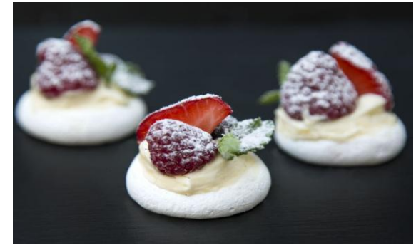
172 Мини-безе Павлова со свежими ягодами и мятой Mini pavlova 12 грамм