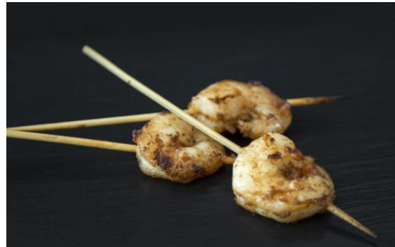
149 Мини-тигровые креветки, обжаренные на гриле с тапенадой из оливок Mini-shrimps on skewer with tapenade 16 грамм