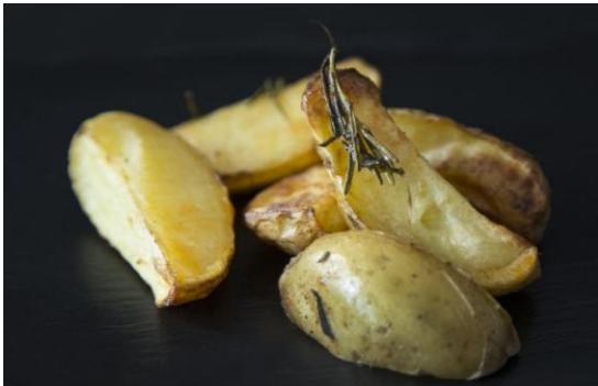
142 Картофель запеченый с розмарином Baked Potatoes 150 грамм