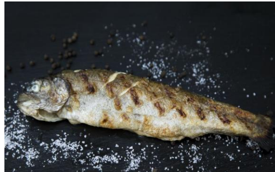
131 Форель гриль Rainbow 230 грамм