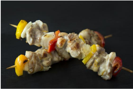
133 Шашлык куриный с овощами Chicken skewers with vegetable 100 грамм