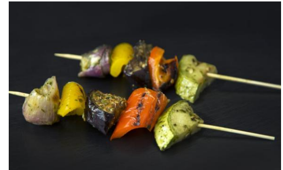
144 Мини-шашлычок из средиземноморских овощей с песто из лесного ореха Mini-baked Mediterranean kebabs with pesto hazelnut 50 грамм