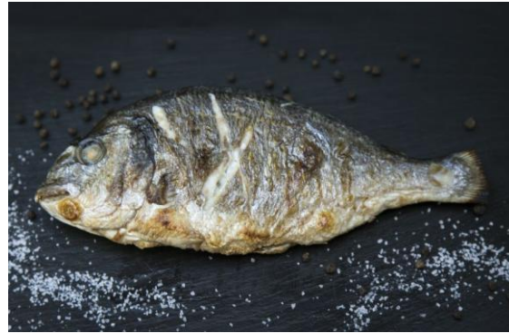
128 Дорато гриль Sea bream 250 грамм