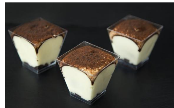
166 Мини-тирамису Mini-tiramisu 40 грамм