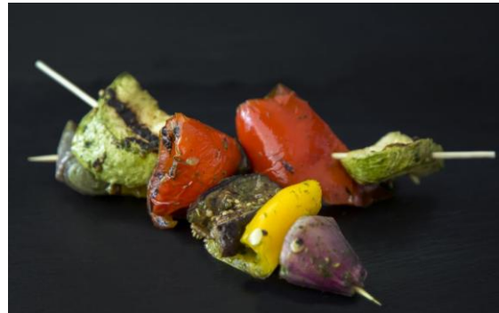
137 Запеченные средиземноморские шашлычки с песто из лесного ореха Baked Mediterranean kebabs with pesto hazelnut 100 грамм