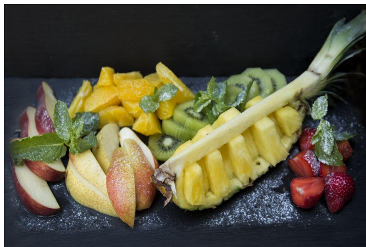
154 Фруктовая тарелка №3 Фруктовая тарелка 957 грамм