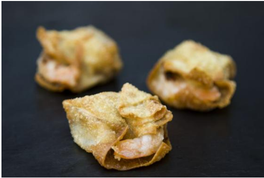
121 Тигровые креветки в тесте фило с тапенадой Prawns in filo dough with tapenade 16 грамм