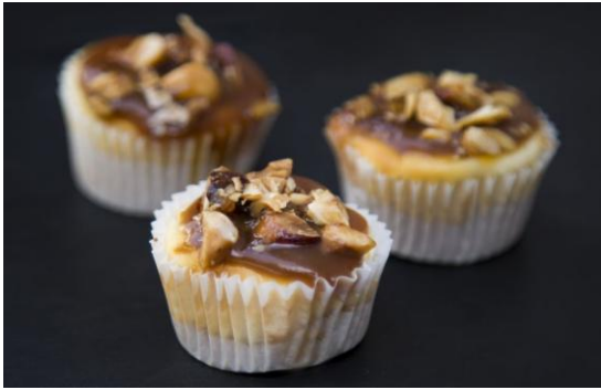
167 Мини-чизкейк с карамелью и фундуком Mini cheesecake with hazelnut & caramel 25 грамм