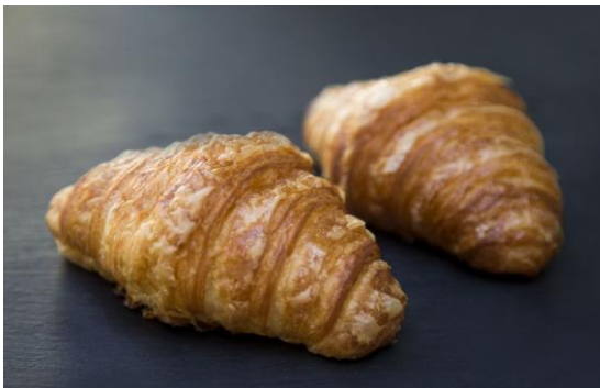
155 Мини-круассан Mini croissant 30 грамм