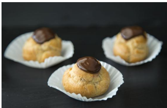
194 Мини-профитроль в ассортименте Mini Profiteroles in assortment 15 грамм