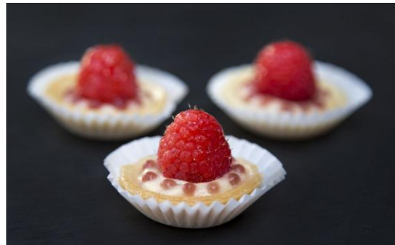
183 Мини-таргалетка с малиной Raspberry mini-tartlet 15 грамм