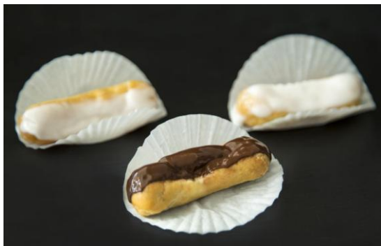
191 Мини-эклер с шоколадным или ванильным кремом Mini Éclair with a chocolate or vanilla cream 15 грамм