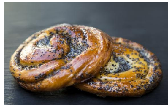
160 Мини-улитка с маком Mini Poppy Snail 30 грамм