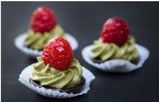
182 Мини-таргалетка с фисташковым кремом и малиной Raspberry and pistachio cream mini- tartlet 18 грамм