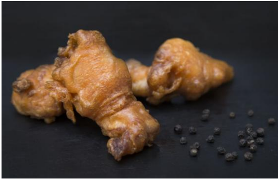
145 Мини-шашлык из курицы по- пинангски Mini-chicken skewers Pinang 16 грамм