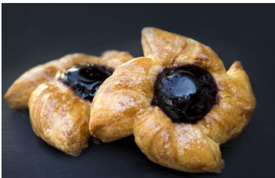
158 Мини-дениш в ассортименте Mini danish in assortment 30 грамм