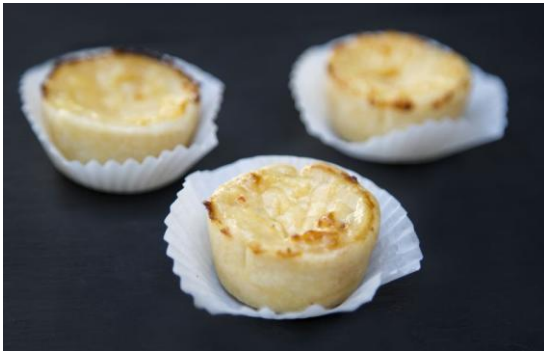
170 Мини-португальская тарталетка с заварным кремом Mini-Portuguese custard tart 20 грамм