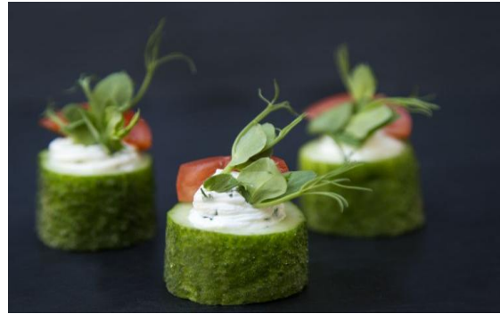
26 Канопе с огурцом, нежным сыром и томатами черри Cucumber with cheese, cherry tomato 22 грамма