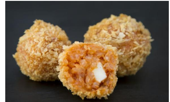
126 Мини-шарики из томатного ризотто с моцареллой Mini-tomato rizzotto balls with mozzarella 25 грамм