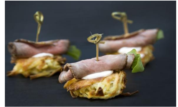
27 Ростбиф с рукколой на картофельном драннике с соусом на основе взбитых сливок Roast beef on Potatoes Roesti with Horseradish 30 грамм