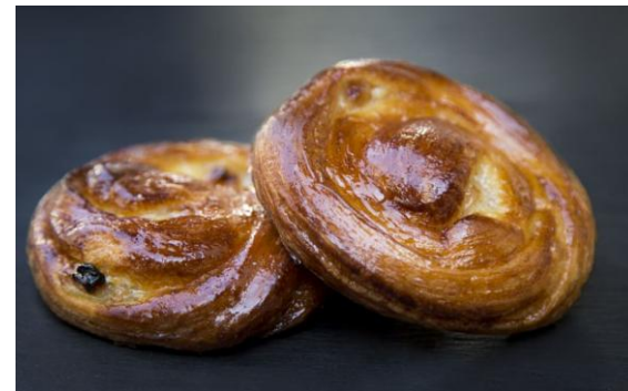
157 Мини-улитка с изюмом Mini snail with raisins 30 грамм