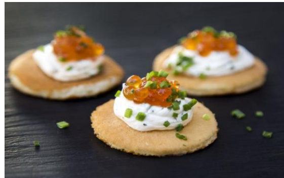
17 Мини-блинчики с лососевой икрой и нежным сыром Mini-pancakes with salmon caviar 20 грамм