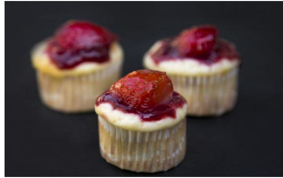
168 Мини-чизкейк с клубникой Mini cheesecake with strawberry 26 грамм