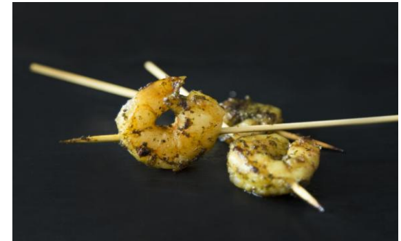
150 Мини-тигровые креветки, обжаренные на гриле с марокканским песто Mini-shrimps on skewer with Moroccan pesto 16 грамм