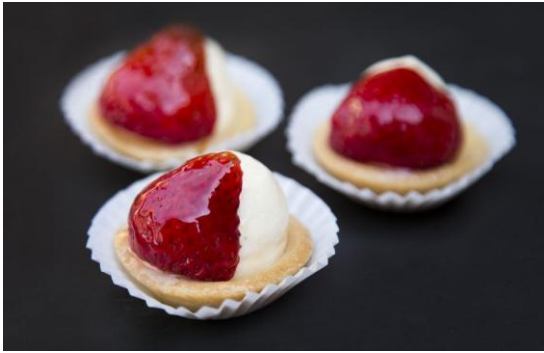
179 Мини-таргалетка с клубникой и сливочным кремом Strawberry mini-tartlet 15 грамм