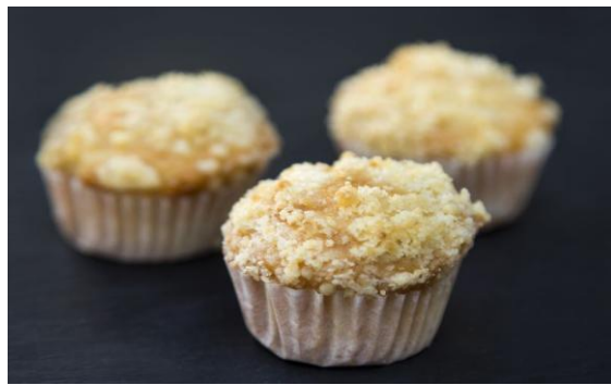
159 Мини-маффин с яблоком Mini cake-apple muffin 15 грамм