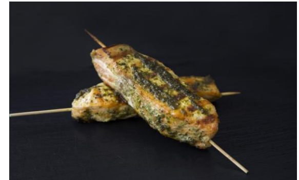
138 Филе лосося гриль, маринованное в марокканском песто Salmon on skewer with Moroccan pesto 70 грамм