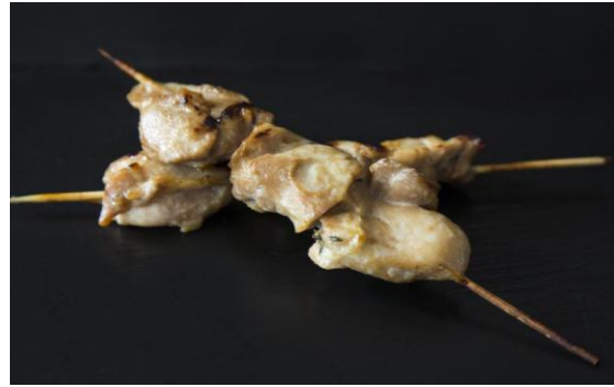
140 Мини-шашлык куриный в имбирно- соевом маринаде Mini-chicken skewers marinated in ginger soy 45 грамм