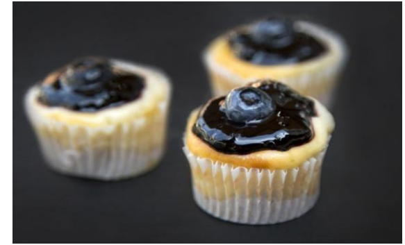
169 Мини-чизкейк с лаймом и голубикой Blueberry cheesecake 25 грамм