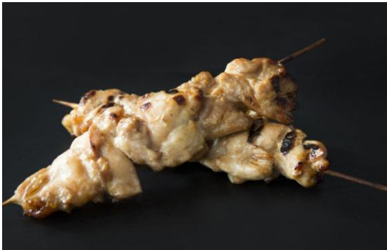
136 Шашлык куриный в имбирно-соевом маринаде Chicken skewers marinated in ginger soy 95 грамм