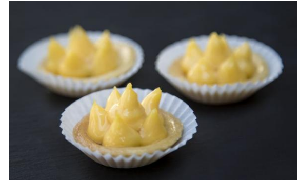
181 Мини-таргалетка с кремом маракуя Passion fruit cream mini-tartlet 15 грамм