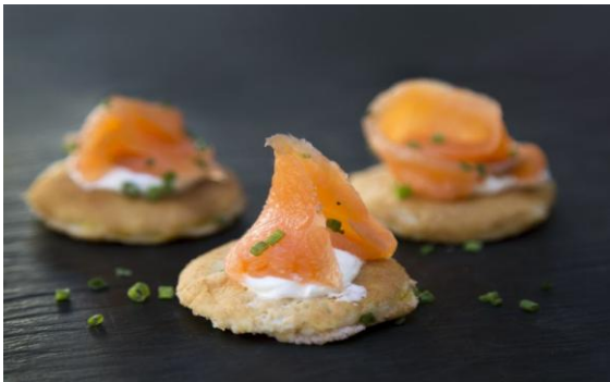
16 Кукурузные блинчики с лососем холодного копчения Corn pancakes with salmon 24 грамм