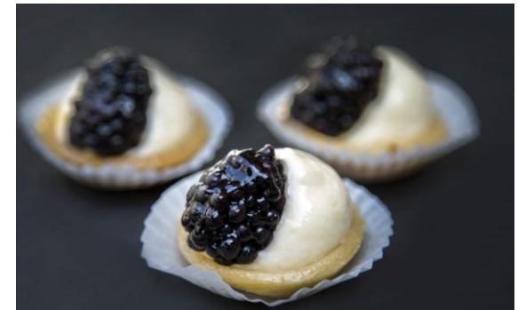
184 Мини-таргалетка с ежевикой Mini-tartlettes with blackberry 16 грамм