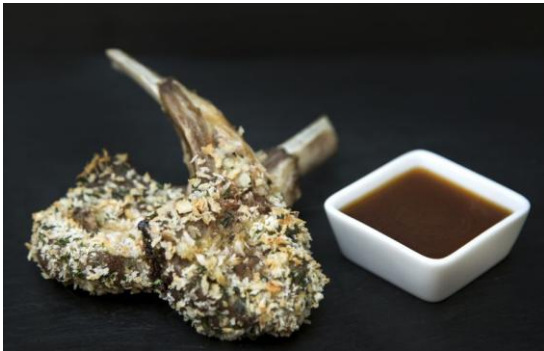
130 Ребрышки молодого ягненка с горчицей Lamb chops with mustard 46 грамм