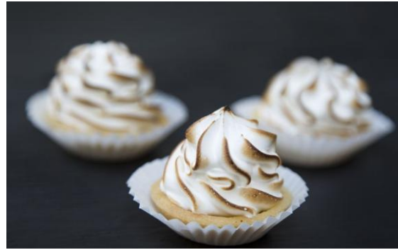
180 Мини-таргалетка лимонная Lemon mini-tartlet 15 грамм