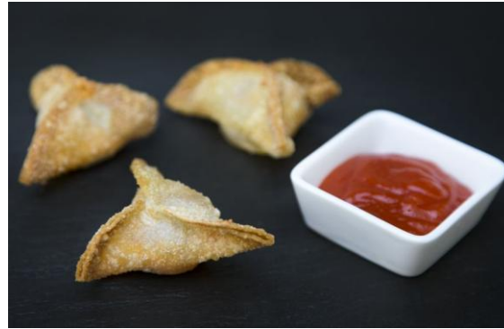
122 Вонтон с перцем Халапеньо Wonton with jalapenos 6 штук по 48 грамм