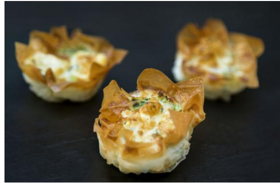
Мини-киш с грибами и шпинатом Mini quiche with mushrooms and spinach 22 грамма