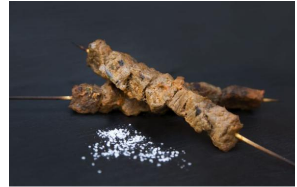
129 Тендерлоин из молодой телятины, маринованный в соусе тандори Tenderloin with Tandori 40 грамм