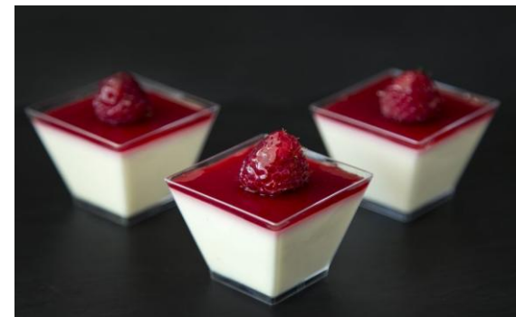
163 Мини-панакотта с ягодами Mini-Panna cotta 50 грамм