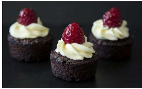
171 Шоколадный фондтант Chocolate fondant 34 грамма