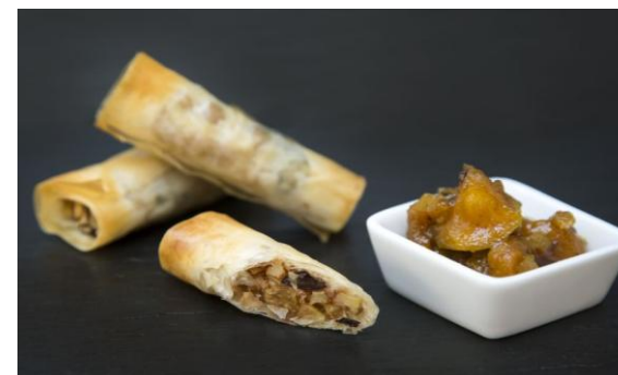
Каннеллони с фермерским творогом и изюмом Cannelloni with curd cheese and raisins 40 грамм