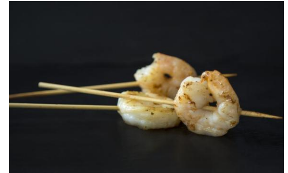
147 Мини-тигровые креветки на шпажке Mini-tiger prawns on a skewer 16 грамм