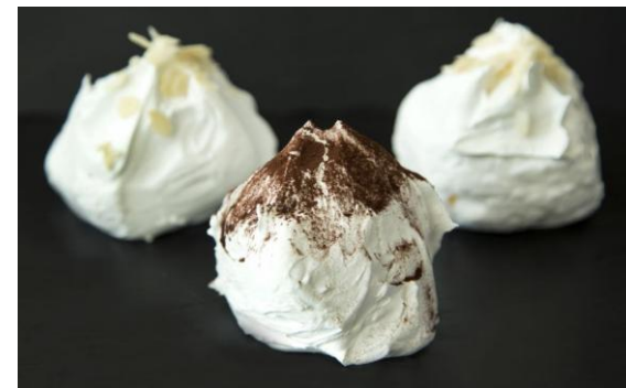
193 Мини-безе Mini merenga 50 грамм