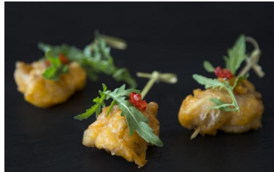
125 Курица в острой панировке Chicken in spicy breading 4 штуки по 44 грамма