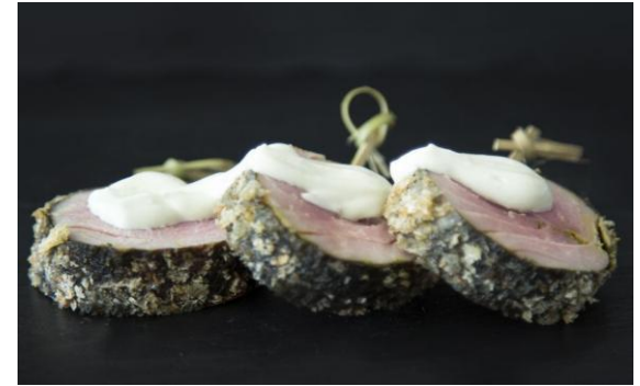
15 Филе тунца с корочкой из марокканского песто Roll with tuna, Moroccan pesto in nori 40 грамм