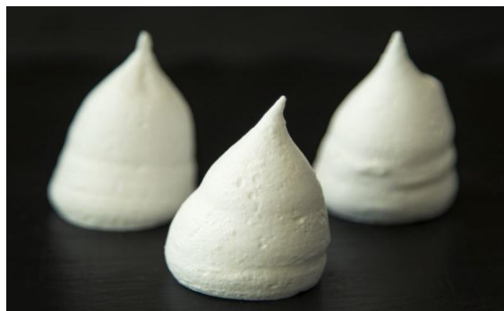
196 Мини-безе «Купола» Mini merenga 15 грамм