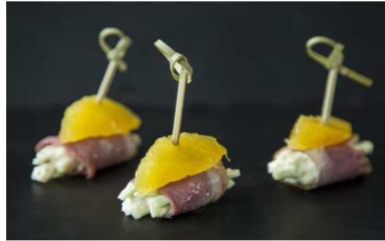
14 Салат Вальдорф с долькой апельсина в копченой утке и со свежей мятой Waldorf salad with orange segment, slice of smoked duck and fresh mint 32 грамма