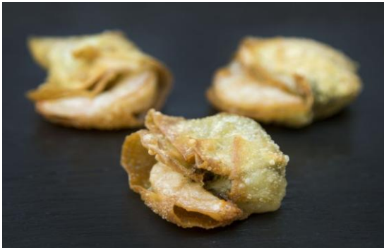
124 Тигровые креветки в тесте фило с марокканским песто Tiger prawns with Moroccan pesto sauce in filo dough 16 грамм