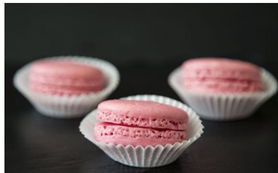
192 Макарон Macarons 12 грамм (Можем предложить любой цвет)