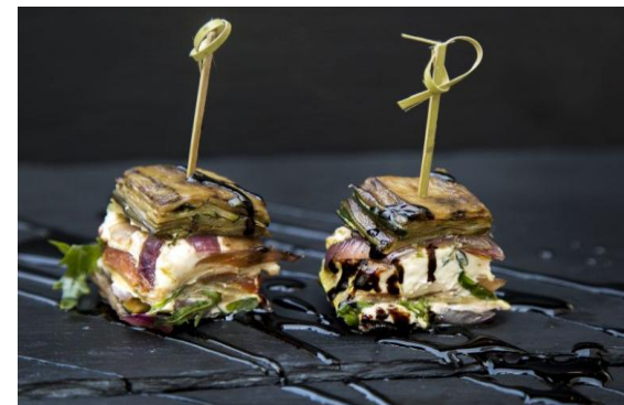
Терин с моцареллой, баклажанами и конкасе Terrine with mozzarella, eggplants and concasse 27 грамм