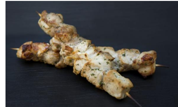
132 Шашлык из свинины с луком, лимонным соком и свежей петрушкой Pork shashlik onion, lemon juice, parsley 120 грамм