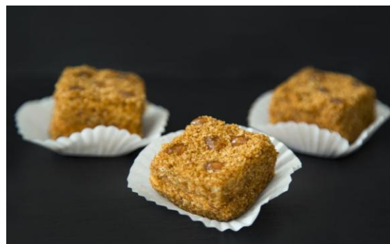
165 Мини-медовый торт Mini-Honey cake 35 грамм