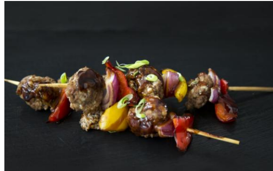
146 Мини-шашлык из митболов с овощами с соусом терияки Mini meatball shishlik with bell pepper & teriyaki sauce 50 грамм