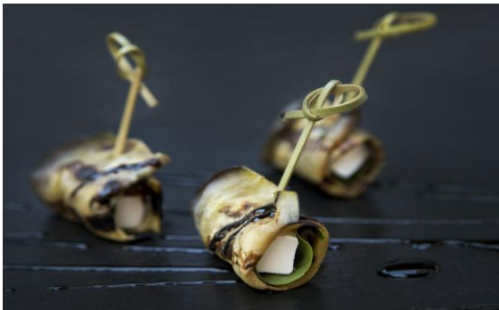
28 Рулет из баклажанов гриль с фетой, сушеными на солнце помидорами и свежим базиликом Grilled Aubergine, Feta, sundried tomato and basil roll drizzled with balsamic reduction 14 грамм