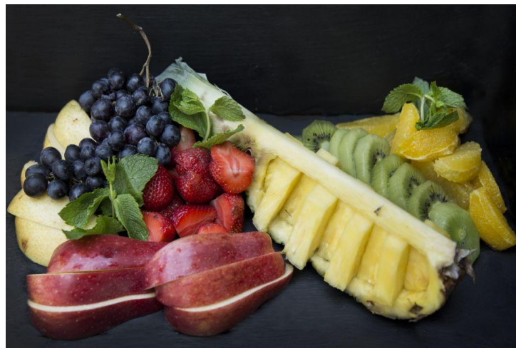
152 Фруктовая тарелка №1 Fruit plate number 1 1150 грамм