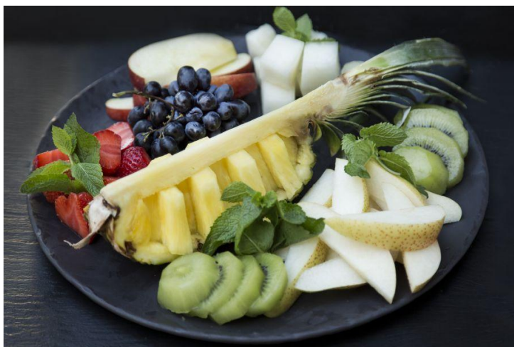
153 Фруктовая тарелка №2 Fruit plate number 2 1000 грамм