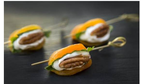
30 Курага с голубым сыром и орехом пекан Dry apricot with blue cheese cream and pecan nuts 16 грамм