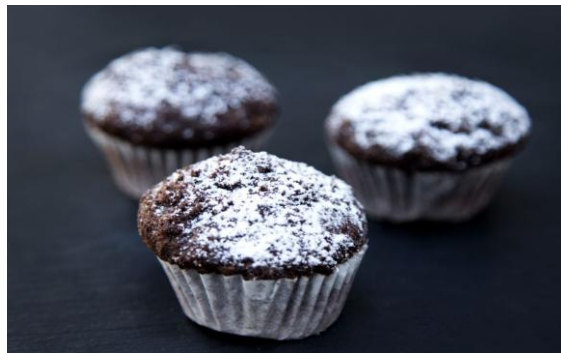
156 Мини-маффин шоколадно-банановый Mini cupcake-chocolate muffin 15 грамм