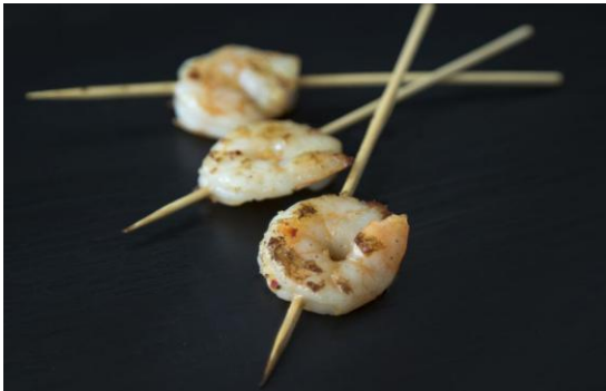
148 Мини-тигровые креветки, обжаренные на гриле с чили и имбирем Mini-shrimps on skewer with chile and ginger 16 грамм