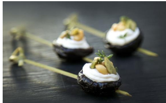
29 Чернослив с голубым сыром и кедровым орехом Prune with blue cheese and pine nuts 14 грамм