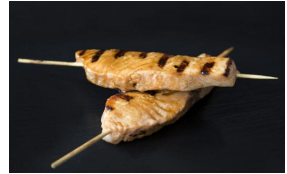
135 Филе лосося гриль, маринованное в соусе терияки с имбирем Salmon on skewer with ginger and teriyaki 70 грамм