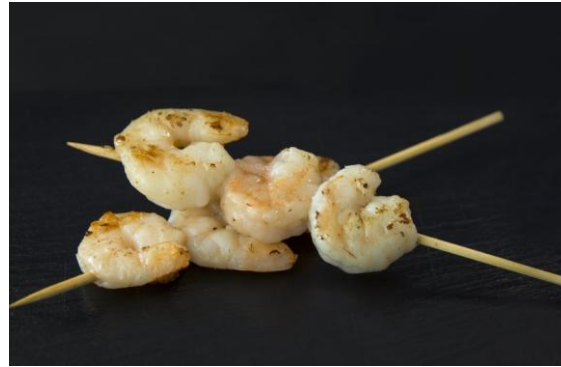
134 Тигровые креветки на шпажке Tiger prawns on a skewer 45 грамм