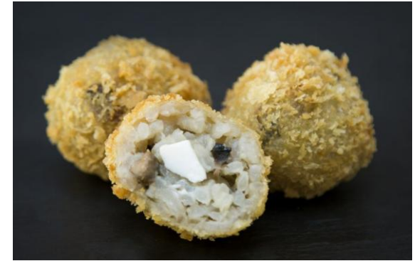
123 Мини-шарики из ризотто, фаршированные шампиньонами и сыром Фета Mini-rizzotto balls with mushrooms and feta 25 грамм