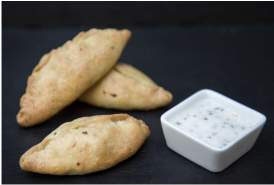
127 Эмпадилья с молодой телятиной и пряными специями Empadilaes with beef 36 грамм