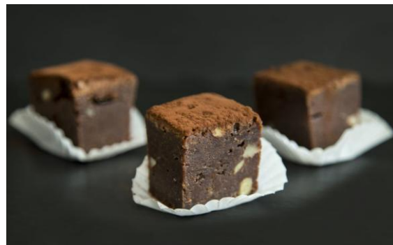
162 Мини-шоколадный брауни с миндалем Mini-chocolate Brownies 30 грамм