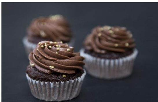
164 Мини-капкейк шоколадный Chocolate mini cupcake 30 грамм