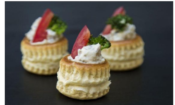
18 Жульен с тигровыми креветками и мидиями в овощном соусе биск со свежим эстрагоном Sea food julienne 15 грамм