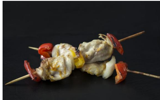
143 Мини-шашлык куриный с овощами Mini-chicken skewers with vegetable 55 грамм