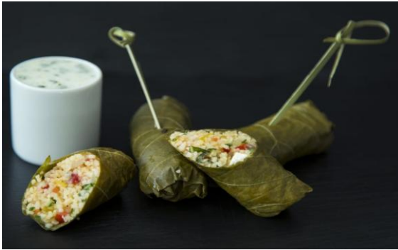
25 Виноградные листья с табуле, восточными специями и травами Wine leaves with tabouleh 35 грамм