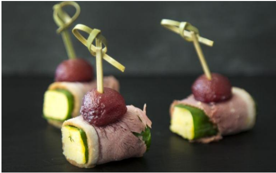
13 Полента в копченой утке со шпинатом и грушей в красном вине Polenta, smoked duck, spinach and pear in red wine 22 грамма