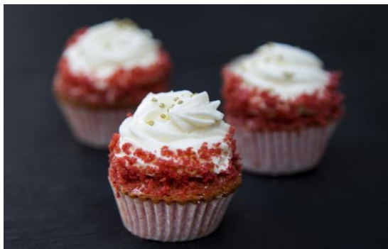
161 Мини-капкейк «Красный бархат» Mini Cupcake «Red velvet» 25 грамм