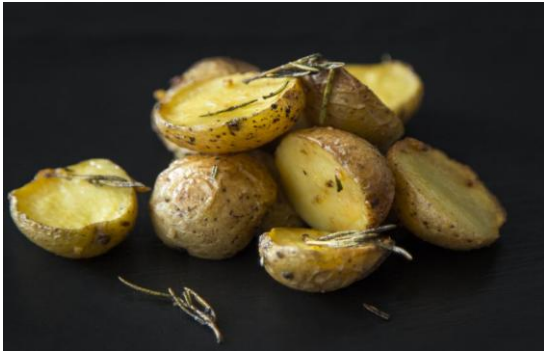
139 Запеченый мини-картофель Baked Mini Potatoes 150 грамм